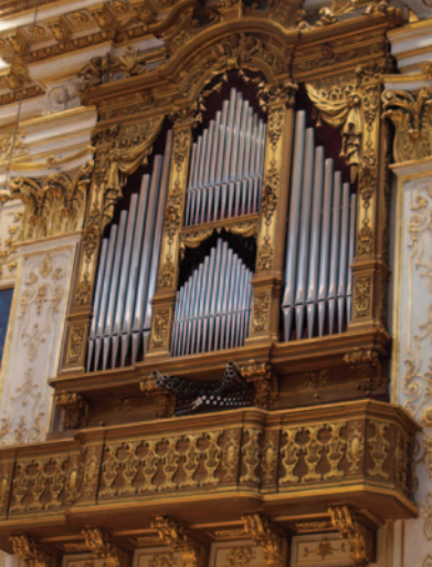
Organo Pietro Corna 2010