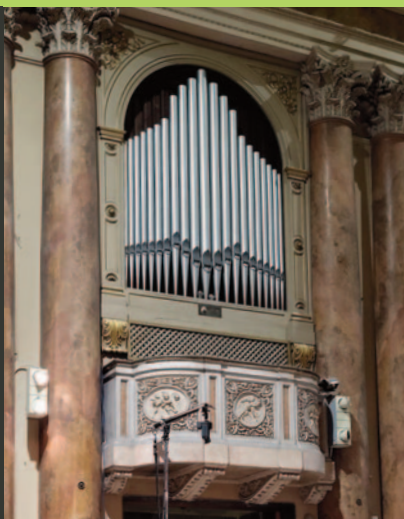
Organo anonimo sec. XVII

Chiesa di Santa Maria Immacolata delle Grazie