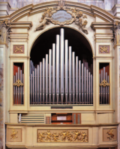
Organo Serassi n.659 1860

Chiesa di Sant'Alessandro della Croce in Pignolo