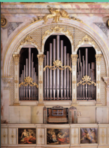
Organo Vegezzi Bossi 1915 Ruffatti 1948